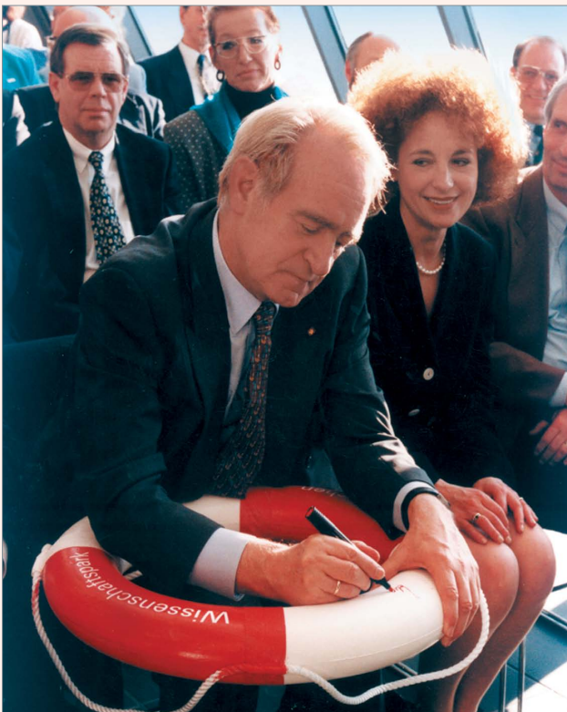
Eröffnung 1995 mit Ministerpräsident Johannes Rau.