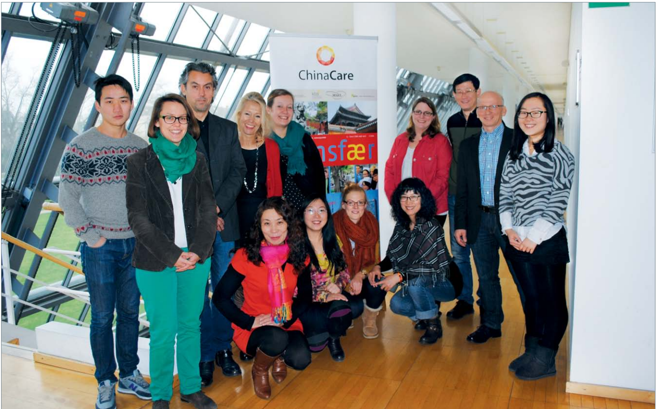
Gelungener Austausch: Die Delegation aus Fushun nimmt Wissen aus der deutschen Altenpflege mit nach China.