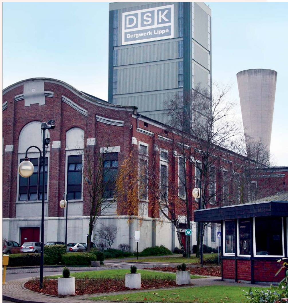
Auch einige Gebäude der ehemaligen Zeche Westerholt sollen als Quartiermittelpunkt neue Funktionen erhalten. (Archivbild)