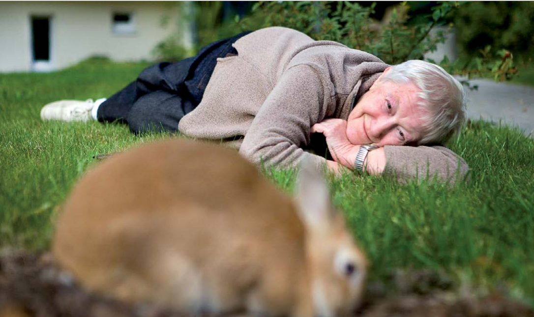
Auf außergewöhnlichen Farbfotoportraits strahlen Demenzpatienten Freude, Würde und Individualität aus – das zeichnet die Bilder von Fotograf Michael Hagedorn aus.