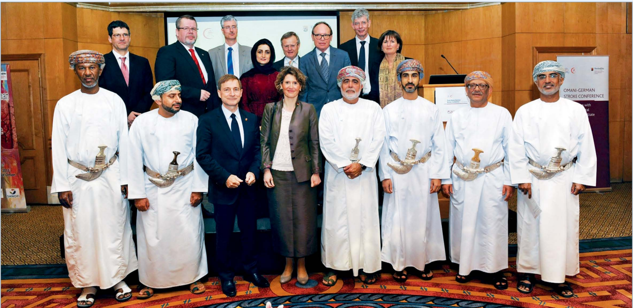
Begrüßung der deutschen Delegation bei Omanisch-Deutschen Schlaganfallkonferenz in Muscat.