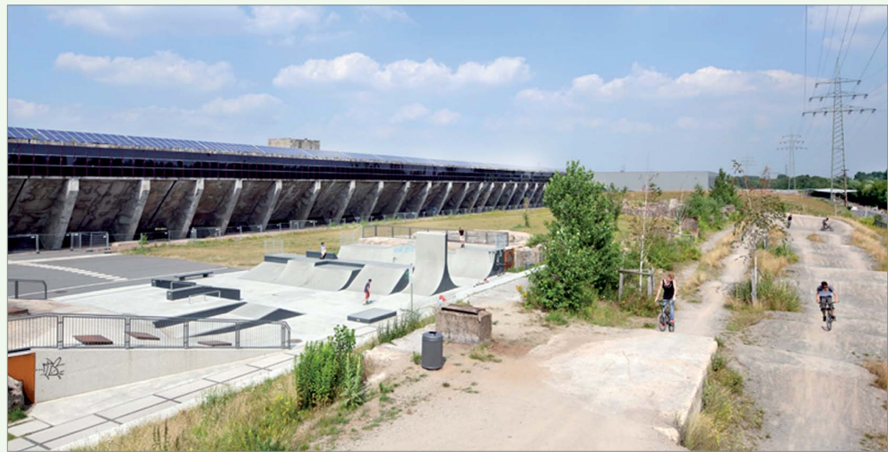
Skateranlage unter dem „Solarbunker“ Schalker Verein

Ausgestellt werden die vier Preisträger des nrw.landschaftsarchitektur.preises2014. Beim Projekt Schalker Verein würdigte die Jury den behutsamen und nutzerorientierten Ansatz für die Wiedernutzbarmachung des Industrieareals, das allmählich von